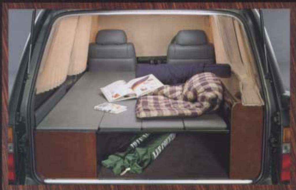
スリーピングベッド&カーテン 写真はTYPE A ベッドスペースは長さ1840mm×幅1140mm