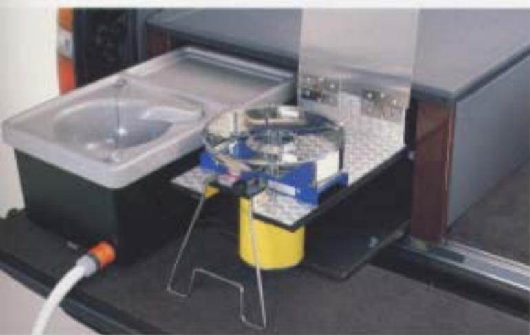
コンロ&シンク(電動ポンプ式流し台)

※特設写真には項目以外のオプションが含まれています。詳しくはディーラーにお尋ねください。