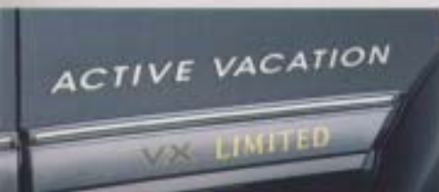
専用エンブレム&ステッカー

桜材を使用したキャビネットは、アウトドアに欠かせない多様なツールをコンパクトに収納。照明や外部オーディオ装置などのパワーソースとなるDC電源(DC12V)を右サイドキャビネット裏に設置。