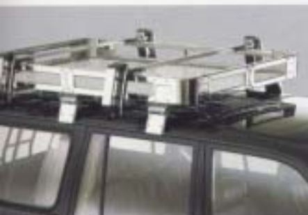
スキーキャリア ルーフラックに装着するスキーキャリア。スタイリッシュなデザイン、美しさも魅力です。(アイワワークス社製)