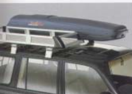
小型ルーフラック&ルーフボックス アウトドライブをサポートするアルミ製小型ルーフラック(幅700mm×奥行700mm) & 320 L ルーフボックス。(アイワワークス社製)