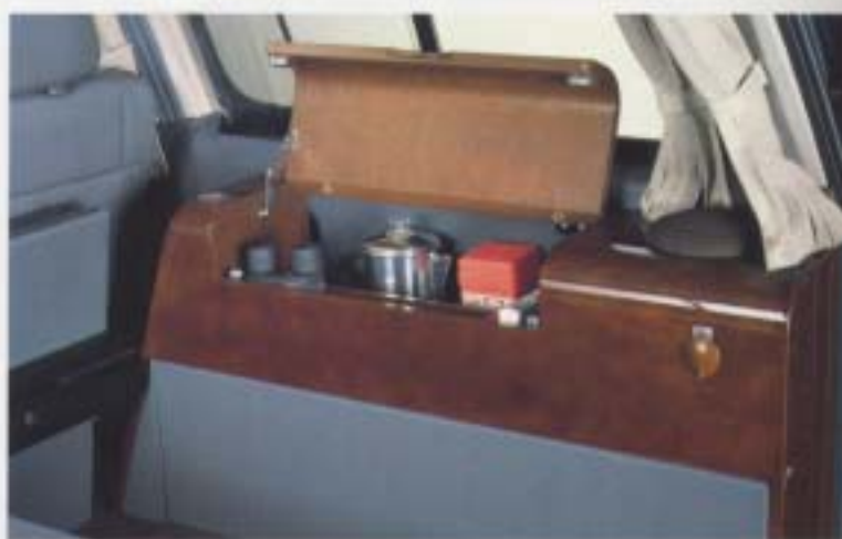
ウッドキャビネット&室内コンセント

1.6リットルのガスコンロと、樹脂製シンクを左サイドキャビネットに収納。扉を開き、スライド式のコンロシンクを引き出せば、料理の準備は完了。給水・排水タンクの容量は各10ℓ。給水タンクはシンク裏、排水タンクは左キャビネット奥より取り出して使用する。