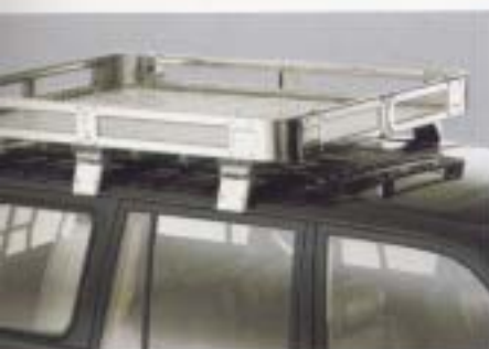
大型ルーフラック アウトドライブをサポートするステンレス製大型ルーフラック(幅1600mm×奥行1300mm アイワワークス社製)