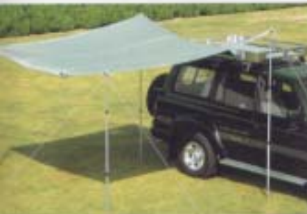
コンパクトサイドテント ルーフラックに装着するコンパクトなサイドテント。テントサイズは幅1000mm×張り出し3000mmで自動巻取り式です。