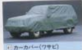
⑧ カーカバー(ワサビ)

キーをはずさず離れた所(200m以内)からドアロック操作が可能。 設定 80系(電装ドアロック付車) ¥25,800