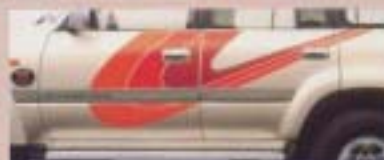
㉔ ストライプテープ(デザインタイプ) (30系用)