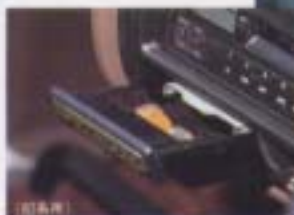
① ノーズモーターボックス