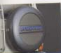
⑤ スペアタイヤカバー(ハードタイプ)

屈強な鋼に覆われて、わたちのない森をくぐる。 大自然のスクリーンを前に、たとえば一杯のカフェロイヤルを飲むために。 ここまで平然と駆けぬる。目的のために用意された機能は、 よりも気まぐれをドライバーに促すのだ。 最上の贅沢な気まぐれを。