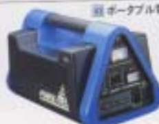
⑩ ポータブル電源(パワーデルタ)

アウトドアカーライフに これ一台。AC100VとDC12Vのい ずれにも使用可能。 ¥41,800*