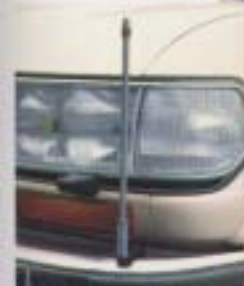
㉓ 大型フェンダーボール