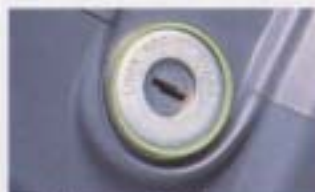
② イグニッションキーリング

ドアも閉めた後も約10秒間点灯する便利なキー、イグニッション。 設定: 80系/STD, GK, 70系/全車型 ¥6,100