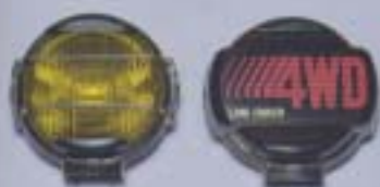
㉘ フォグランプ(ハロゲン)

シンプルながらロゴタイプでアウトドアを楽しむのに最適。 設定・全車型 ¥21,500 色:レッド・ブラック