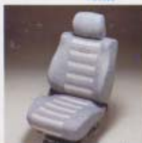
⑤ シートカバー(カジュアルスポーツII)

センター部にクッション性を高めたスポーティな高級タイプ。 設定: 全車型 3人乗り ¥21,800, 5人乗り ¥30,700