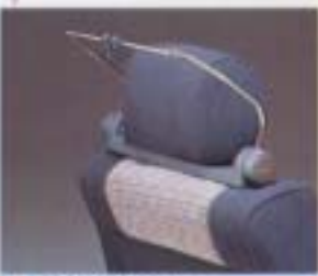
⑦ インルームハンガー

耳触しをわすれず、室内をドレスアップ。 設定: 80系/全車型(後/STD) 70系/1FL, セ1コンテ ¥27,700