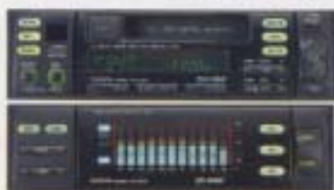
⑧ CDチェンジャーコントロール付ワンボディーステレオ&電子グラフィックイコライザー

AM/FM、カセット、CDチェンジャーコントロール機能を10本に搭載した多機能ワンボディーステレオと鮮やかな音づくりが可能な7バンド電子グラフィックイコライザーの先進システム。