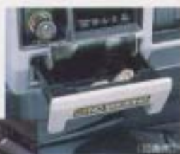
扉開きの時に目に入るさりげないインナートリム。 設定:全車型 ¥1,500*

車のように深い個性な時期に身をゆだねたいし さえぎるものがないBGMに揺られて、 はるかなクルージングへの思いにふけりたいし ほかに誰にも譲れない、自分だけのポジション、 その獲得のために、オリジナル用品へのこだわりは、 もっと厳密になってくる。