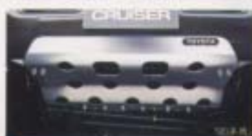
⑬ フロントアンダープロテクター

フロントグリルをスタイリッシュに演出する防振専用バー。 設定：標準/全車型(後1500/2000/2500/3000/4000/4500) ¥50,500 ※実際の商品写真は写真より全高が低くなっております。(F2500m)