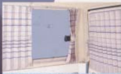
⑥ 室内カーテン(クォーター&リヤウィンドウ)

スポーティなデザインとかわやかな足踏りのローライナー。 *設定: 全車型 3人乗り ¥21,800, 5人乗り ¥30,700