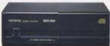
⑨ CDオートチェンジャー(12枚タイプ)