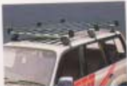
② ルーフラック(高純タイプ)