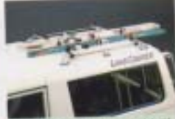
③ 高純システムラック(スキーラックセット)