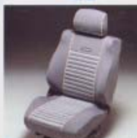
④ シートカバー(カジュアルスポーツI)

本車型ホルダーだけのシンプルなデザインキー。 設定: 70系/全車型 ¥3,800