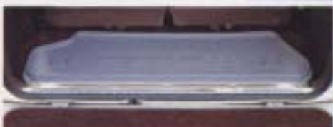
⑫ ラゲージトレイ(小型)