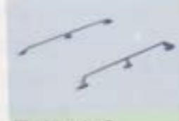
④ アクションレール