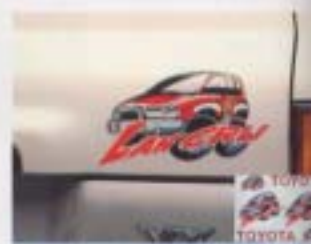
⑭ アクセントステッカー(専用タイプ)

軽やかに個性を輝かせるワンオフオリジナル ステッカー。 設定：全車型 ¥4,000*