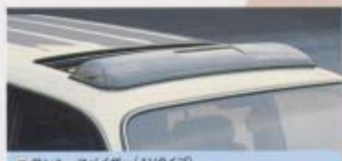
㉑ サンルーフバイザー(AVタイプ)

直射日光を遮り、空気の流入量を調節。一時的の雨にも威力を発揮。 設定・全車型(軽(STD)、70系(LX)、70系電動ルーフレール付車) 60系 ¥15,400 70系 ¥18,900