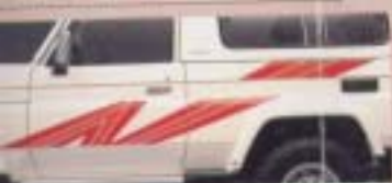
⑥ ストライプテープ(デザインタイプ) (70系用)