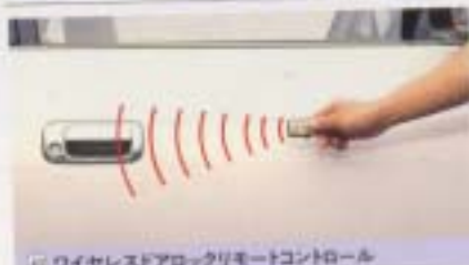
⑦ ワイヤレスドアロックリモートコントロール

キーをはずさず離れた所(200m以内)からドアロック操作が可能。 設定 80系(電装ドアロック付車) ¥25,800