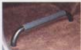
⑧ フットレスト(助手席用)

助手席シート背-腰2ヶ所で使用できる便利なハンガー。不要時はシートバックに収納。 設定: 80系/VX, V611シート 70系/2X ¥4,300