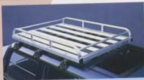
① アルミラック(ヘビーデューティ)

設定 80系/全車型、70系/全車型(除く軽・FFHタイプ) 設定 ¥130,000*、70系/FFH ¥140,000* 軽 ¥130,000*