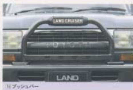
⑫ ブッシュオーバー

フロントグリルをスタイリッシュに演出する防振専用バー。 設定：標準/全車型(後1500/2000/2500/3000/4000/4500) ¥50,500 ※実際の商品写真は写真より全高が低くなっております。(F2500m)