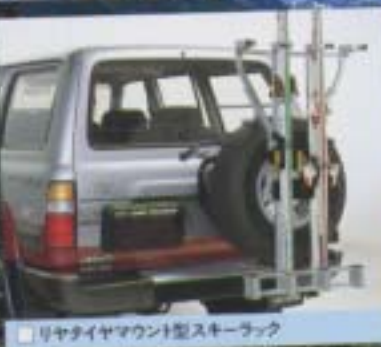
⑤ リヤタイヤマウント型スキーラック