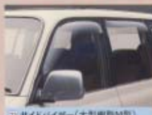
㉒ サイドバイザー(大型樹脂M型)

直射日光を遮り、空気の流入量を調節。一時的の雨にも威力を発揮。 設定・全車型(軽(STD)、70系(LX)、70系電動ルーフレール付車) 60系 ¥15,400 70系 ¥18,900