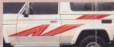
㉕ ストライプテープ(デザインタイプ) (70系用)

ワイドなデザインラインで横の力強さをアピール。 設定・全車型(軽(STD)) ¥24,500 色:レッド・グレー 設定・70系/全車型 ¥28,500 色:レッド・ブラック