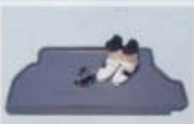
⑬ ラゲージトレイ(大型)