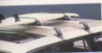
① システムラック(ベースラックセット) ¥21,000*