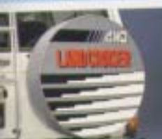
⑥ スペアタイヤカバー(タイプ1)