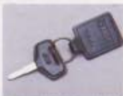
③ マスコットキーホルダー

ドアも閉めた後も約10秒間点灯する便利なキー、イグニッション。 設定: 80系/STD, GK, 70系/全車型 ¥6,100