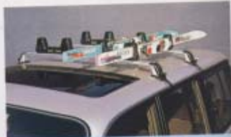
② 高級樹脂システムラック(スキーラックセット)

設定 80系/全車型、70系/全車型(除く軽・FFHタイプ) 設定 ¥130,000*、70系/FFH ¥140,000* 軽 ¥130,000*